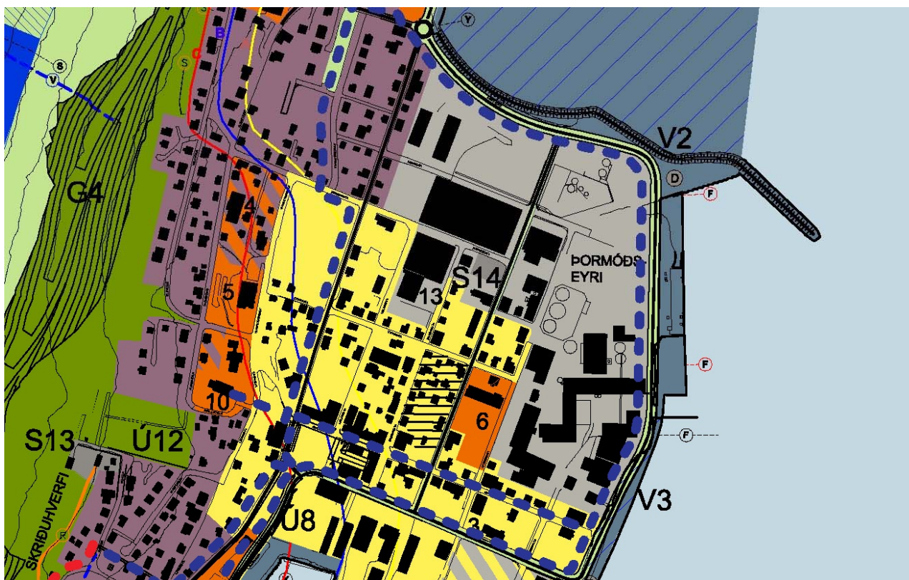
Mynd 5. Hluti aðalskipulags Fjallabyggðar, Siglufjörður, 2008-2028

Aðalstigur mun liggja meðfram fyrirhugaðri stofnbraut á hafnarsvæðinu, byggðarmegin.