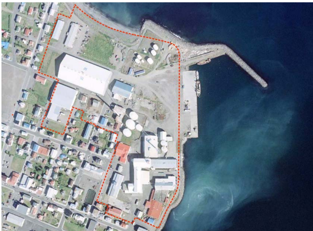
Mynd 1. Afmörkun skipulagssvæðisins. Undirliggjandi loftmynd er frá árinu 2010

Skipulagssvæðið er alls um 10,5 ha að flatarmáli.